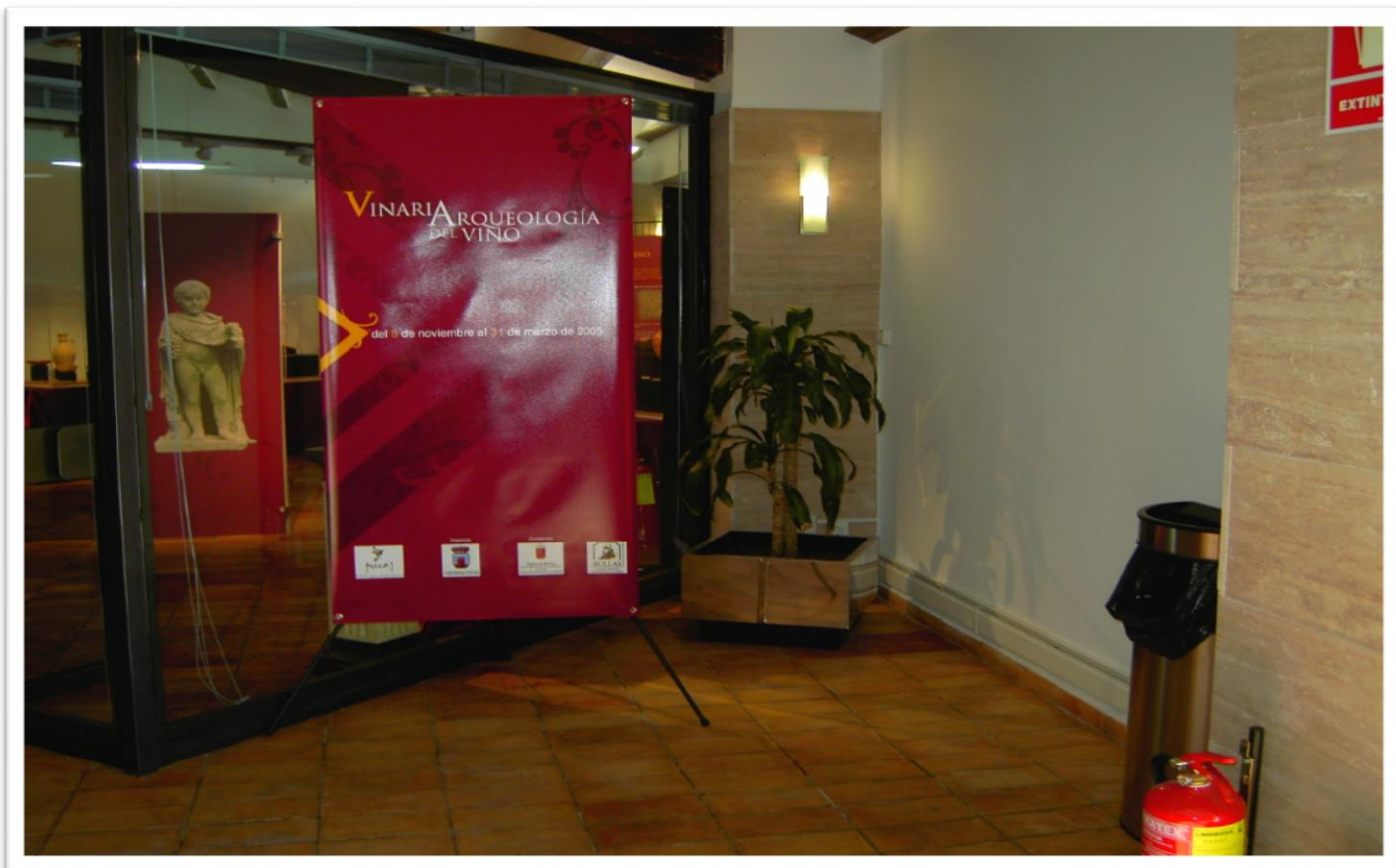
Instalación en Museo del Vino en Bullas (Murcia)